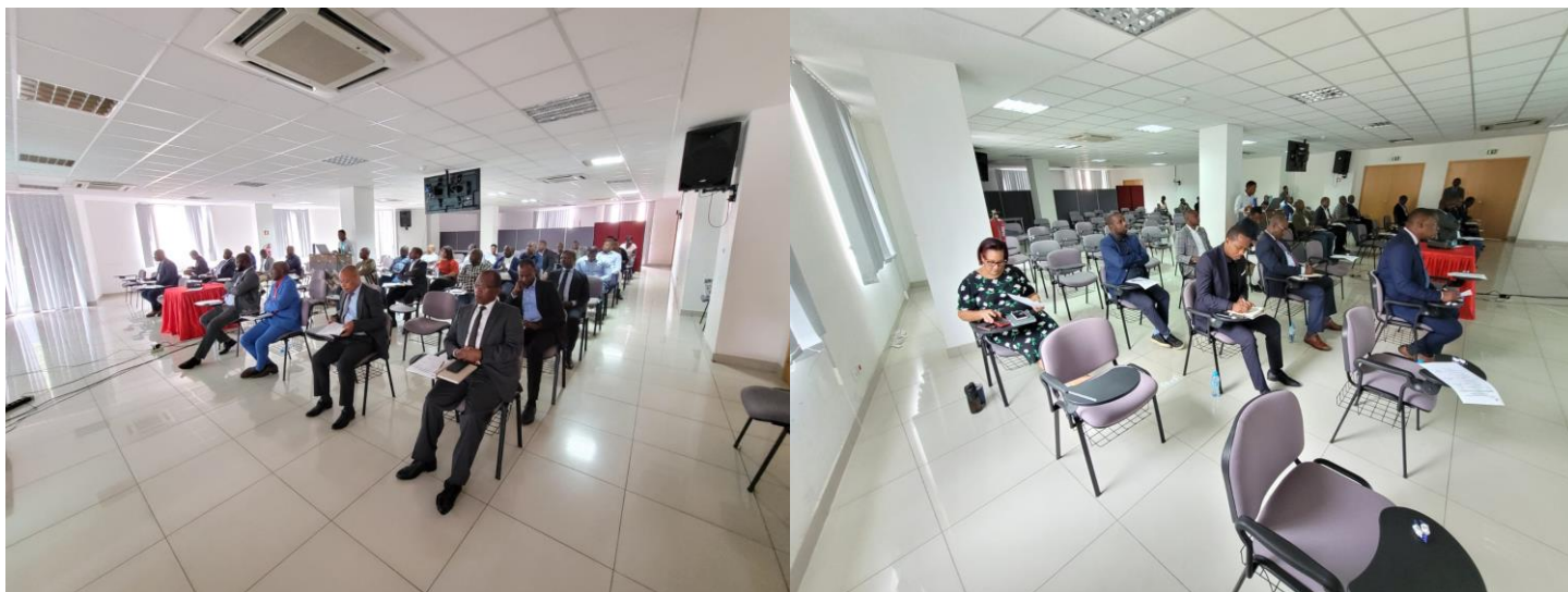
Participantes ao encontro: convidados de diversas instituições, Directores Nacionais, Directores Adjuntos, chefes de departamentos, consultores do PIU e técnicos de diferentes orgânicas do INE.