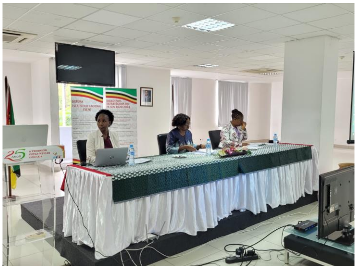
A presidente do INE no centro, ladeada á esquerda pela Directora Nacional de Integração, Coordenação e Relações Externas e a direita pela Coordenadora da Unidade de Implementação do