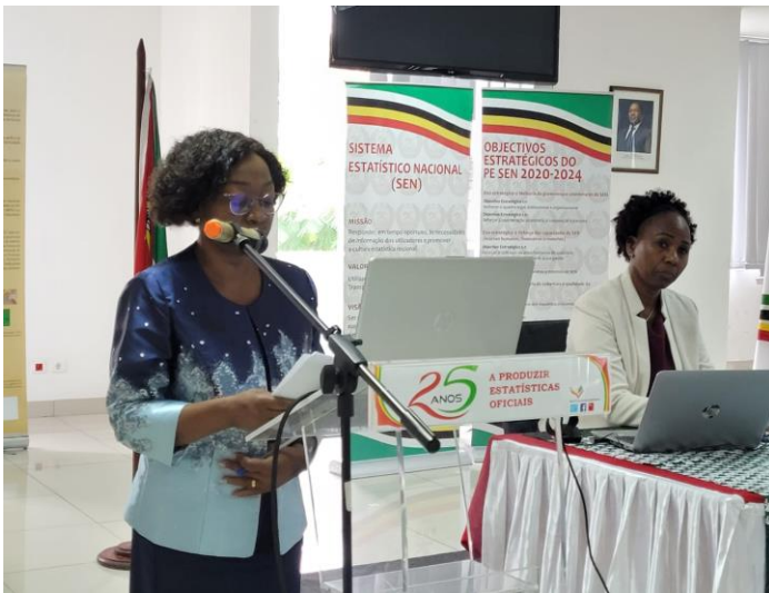
Discurso da abertura proferido pela presidente do Instituto Nacional de Estatística